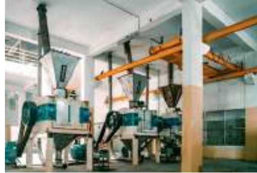
Цех переработки пищевых и промышленных сортов в соответствии с системами сертификации ISO

Оба подразделения работают под техническим контролем Linkin и соответствуют международным стандартам, включая сертификацию по стандартам ISO 9001:2015, ISO 22000:2018 и FDA . Приверженность компании к документации, прозрачности и единообразию гарантирует соответствие каждой партии продукции мировым стандартам качества — основная причина, по которой Linkin Guargums стала предпочтительным поставщиком как для пищевой, так и для промышленной отрасли.