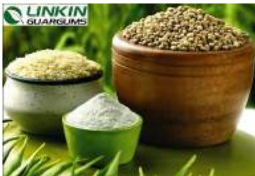
Путь от семян гуара до гуарового сплита и переработанного порошка

В основе деятельности Linkin Guargums лежат два производственных предприятия третьего поколения , стратегически расположенных в эпицентре выращивания гуара в Индии , что обеспечивает доступ к высококачественному сырью и геологическое преимущество близости к источнику.