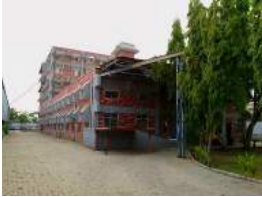
Зона экспортной погрузки, где осуществляется подготовка грузов с полной документацией

качества и прослеживаемости от источника до поставки компания гарантирует чистоту, надёжность и эффективность.